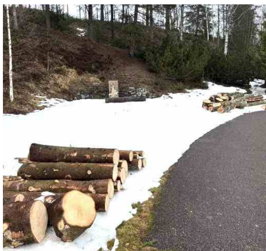
Den uppståndne Jesus med segerfana i böneträdgården på Kanaan i Tyskland. →

Som ni vet var vi tvungna att ställa in sommarens samling på Bjerkely Folkhögskola förra året, men nu gläder vi oss åt att kunna bjuda in till en retreat den 18–21 juni. En och annan anmälde sig redan i januari – det är uppmuntrande att veta att det för några faktiskt är så viktigt att träffas på det här sättet!