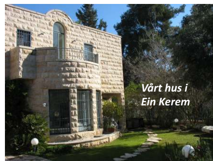
Vårt hus i Ein Kerem

En gång ljud ropet i borgen hos Pilatus: "Korsfäst!" Även i dag ljuder detta rop. Fienden vet att han bara har kort tid kvar. Han döljer sig inte längre utan träder fram offentligt, pervers och full av hat mot allt som är heligt. Men den korsfäste Jesus har uppstått och lever. Han är mitt ibland oss genom sin Ande och i sitt Ord. Runt omkring spirar det en längtan efter att leva ett helgat liv, att få möta Jesus, i kammaren och i gemenskapen.