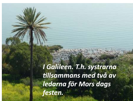
I Galileen. T.h. systrarna tillsammans med två av ledarna för Mors dags festen.

Filmen finns på norska på YouTube: "En hage for Jesus".