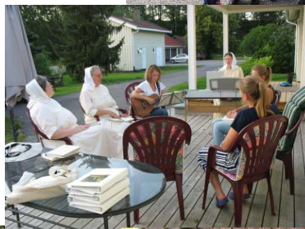
Tillbedjan ute en sommarkväll