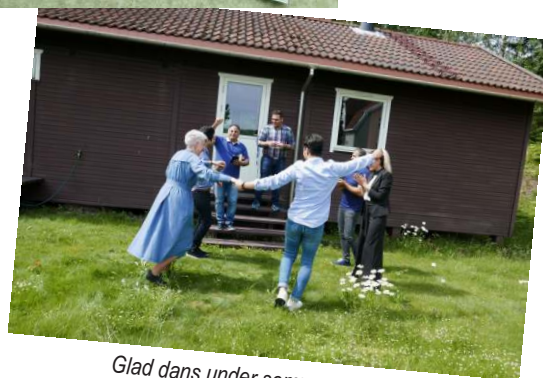
Glad dans under sommarens retreat