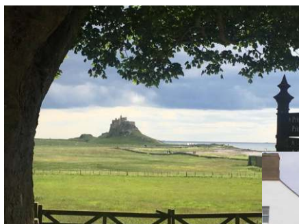
Munken Aidan som grundade klostret på Lindisfarne ↗

Under midsommarhelgen hade vi vår årliga större retreat på Bjerkely folkhögskola. Det är alltid glädjande när nya finner vägen dit. Bland dem var en kvinna i 60-årsåldern som nyligen hade mött Jesus. Efter att ha växt upp hos Jehovas Vittnen och sen ha förvillat sig in i New Age i många år fick hon äntligen komma hem till sin himmelske Far. Allt från det gamla livet hade hon bokstavigt talat bränt upp och törsten efter nytt liv var stor. Efter att ha rensat bokhyllorna hade hon nu gott om plats och hon reste glädjestrålade hem med alla böcker vi kunde erbjuda. Som tidigare "insider" i New Age-