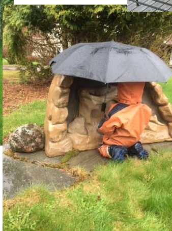
↖ Lazarus skyddar Jesus i Getsemane mot regnet